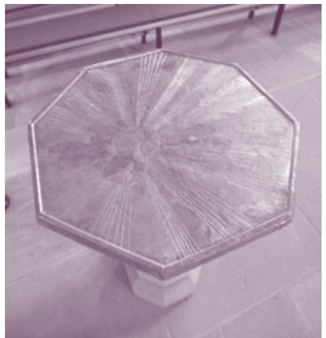
Taufstein Wiesbach, Abdeckung

Die Magdeburger Erklärung zur gegenseitigen Anerkennung der Taufe im Jahr 2007 hat hier bereits ermutigende Impulse gesetzt, wie auch weiterhin in der Tradition und Rezeption des sog. Lima-Papieres aus dem Jahr 1982 (Konvergenzerklärung zu Taufe, Eucharistie und Amt der Kommission für Glaube und Kirchenverfassung des ÖRK) motivierende und korrigierende Aussagen in die aktuellen ökumenischen Gespräche eingebracht werden können.