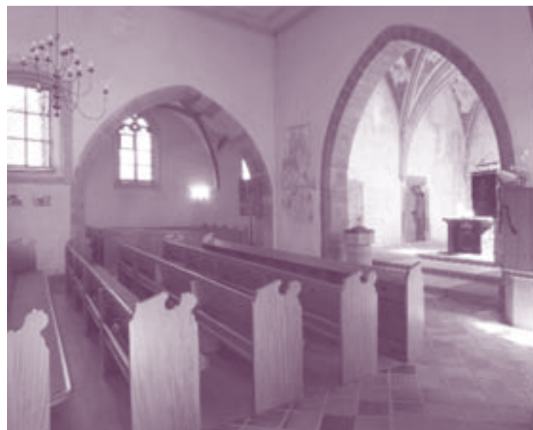
Ev. Kirche Minfeld

Es muss wieder eine Kultur der aktiven gegenseitigen Anteilnahme innerhalb der Kirchengemeinde entstehen.