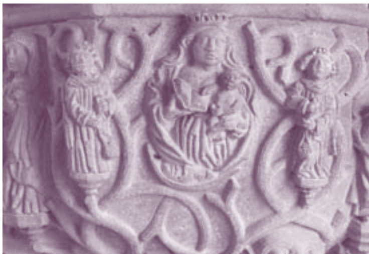
Ev. Kirche Sausenheim, Taufstein

Wichtig ist zuallererst, dass eine Gemeinde einen Blick für die Menschen entwickelt, die in ihrem Einzugsgebiet wohnen, diese Menschen in ihrer Lebenslage wahrnimmt, in Kontakt tritt und konstruktive Angebote den Bedürfnissen der Menschen entsprechend, mit den Menschen gemeinsam entwickelt.