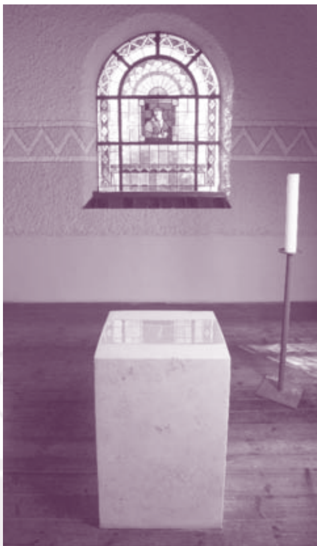
Ev. Kirche Hassel, Taufstein